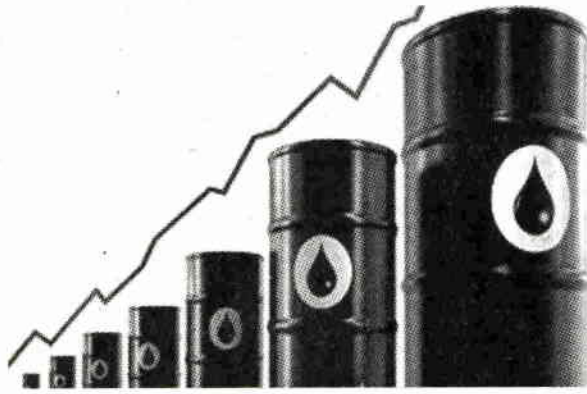
กราฟิกแสดงการปรับเพิ่มสูงขึ้นของราคาน้ำมันดิบในตลาดโลก