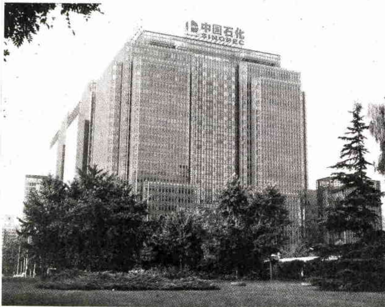
สำนักงานใหญ่ของซิโนเปก คอร์ป ในกรุงปักกิ่ง เมืองหลวงของจีนแผ่นดินใหญ่