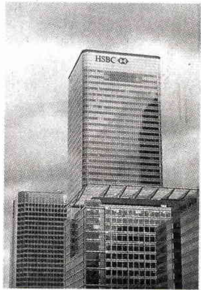
ธนาคารเซี่ยงไฮ้และฮ่องกงกวงเบงกิงคอร์ปอเรชัน” หรือ “เอชเอสบีซี” สำนักงานใหญ่ใน กรุงลอนดอน ประเทศอังกฤษ