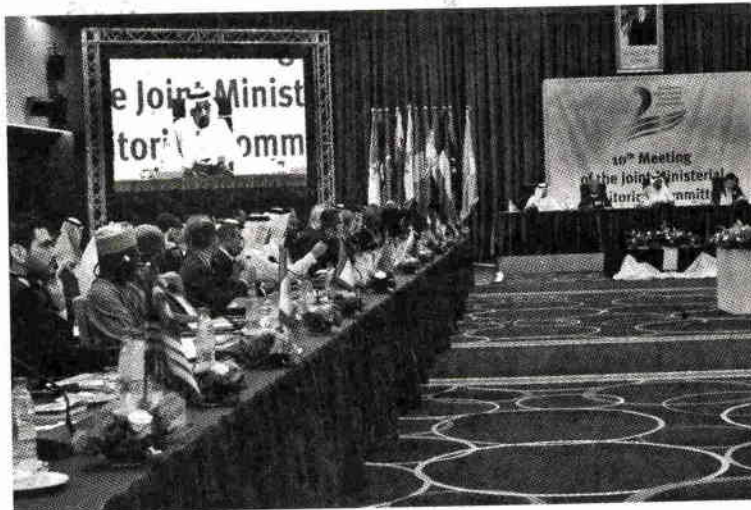
ที่ประชุมโอเปกและนอนโอเปก ณ กรุงแอลเจียร์ ประเทศแอลจีเรีย ยืนยันการคงกำลังการผลิตน้ำมันดิบป้อนสู่ตลาดโลกไว้เท่าเดิม