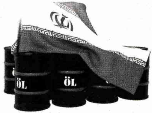
ปัญหาอิหร่านกับสถานการณ์น้ำมันดิบในตลาดโลก