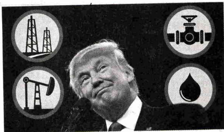
ภาพตกแต่งแสดงประธานาธิบดีโดนัลด์ ทรัมป์ ผู้นำสหรัฐฯ กับปัญหาราคามัน

อย่างไรก็ดี บรรดานักวิเคราะห์ก็ ยังแสดงทรรศนะชี้ทิศทางกันต่อไปว่า 100 ดอลลาร์ฯ คือ ราคาน้ำมันดิบต่อ บาร์เรลที่คาดว่าจะได้เห็นสำหรับการซื้อขายกันในอนาคตไม่ไกลนับจากนี้โดย