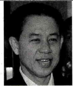
พล.ท.สรรเสริญ แก้วกำเนิด