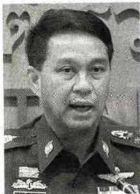
พล.ต.อ.เดชณรงค์ สุทธิชาญบัญชา