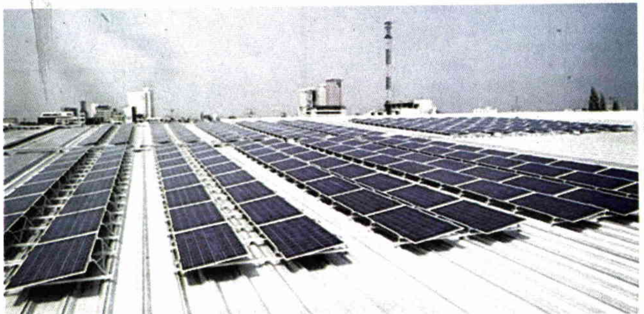
โซลาร์รูฟท็อปเขย่าวงการธุรกิจไฟฟ้า