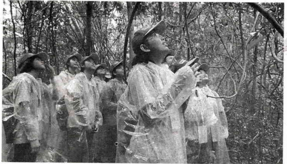
น้องๆ ร่วมเดินป่าศึกษาธรรมชาติ

ดังนั้น ทางบริษัท ปตท.สำรวจและผลิตปิโตรเลียม จำกัด (ปตท.สผ.) ร่วมกับ สำนักงานคณะกรรมการการศึกษาขั้นพื้นฐาน กรมส่งเสริมคุณภาพสิ่งแวดล้อมและมูลนิธิยุวสถิรคุณ สร้างจิตสำนึกรักษ์ทรัพยากรธรรมชาติและสิ่งแวดล้อม โดยได้จัดค่าย PITEP Teenergy ปี 4 ที่ได้ดำเนินการต่อเนื่อง ซึ่งในครั้งนี้ได้มาจัดที่ภาคอีสาน ณ โครงการท่องเที่ยวเชิงนิเวศฝอยลม จ.อุดรธานี ภายใต้แนวคิด ก้าวเพื่อรักษ์ ที่ขับเคลื่อนด้วยกลยุทธ์ 3 ป. ปลูก-ปั้น-เปลี่ยน โดยนำนักเรียนชั้นมัธยมศึกษาตอนปลาย