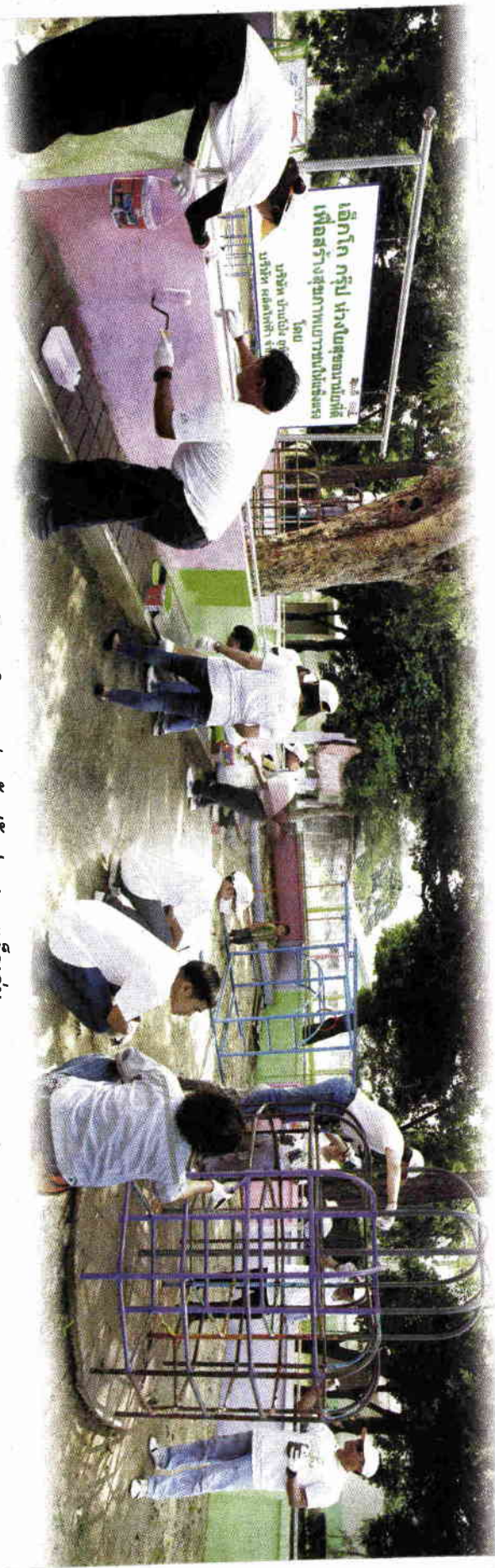
พนักงานจิตอาสาสร้างกำแพงรับรู้งานของเด็กเล่น