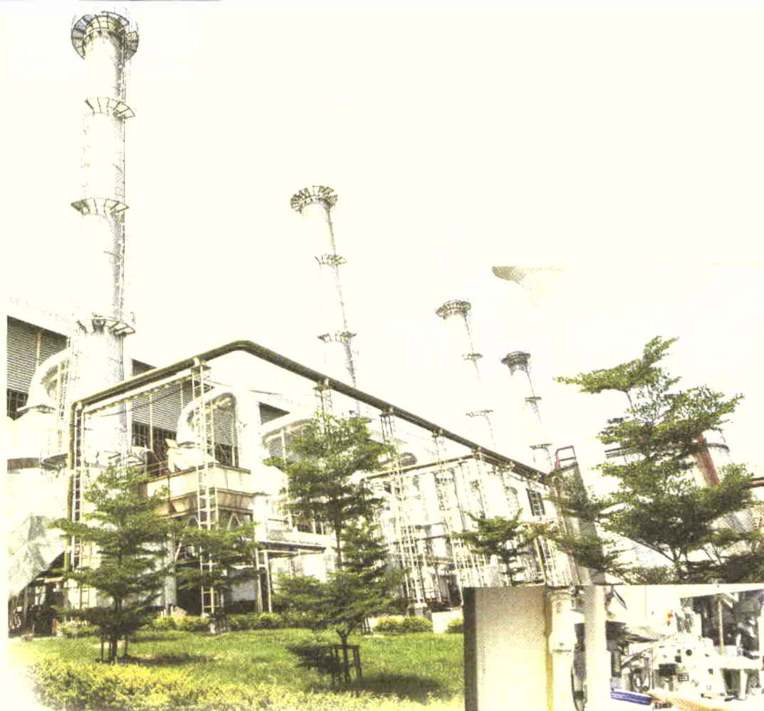
ในฐานะองค์กรชั้นนำแห่งหนึ่ง เคเอสแอล มีจุดยืนที่มั่นคงในการสร้าง การเติบโตอย่างยั่งยืน การมีภาพลักษณ์ที่ดีและน่าเชื่อถือ ยึดมั่นในหลัก