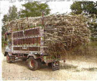
อ้อยจากเกษตรกรรายย่อย

โรงงานน้ำตาลมิตรภูเขียว อุทยานวิจัยมิตรผล และบริษัทน้ำตาลขอนแก่น จำกัด โรงงานน้ำตาลทิพย์สุโขทัย บริษัท เกษตรไทยอินเตอร์เนชั่นแนลซูการ์ คอร์ปอเรชั่น จำกัด (มหาชน) จังหวัดสุโขทัย และนครสวรรค์ อีกด้วย