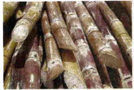
อ้อยคุณภาพ