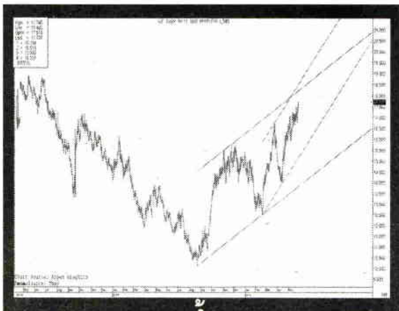
ราคาน้ำตาล

ถ้าพิจารณาแนวโน้มของราคาน้ำตาลกับราคาหุ้น KSL ก็ต้องบอกว่า ราคาน้ำตาลขึ้นไปไกลมากเมื่อเทียบกับการปรับตัวเพิ่มขึ้นของราคาหุ้น KSL ที่เพิ่งเริ่มฟื้นตัว